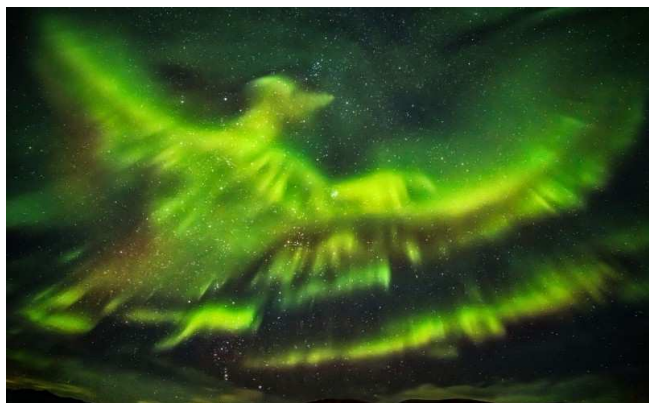
Hallgrimur P. Helgason

Eine Phoenix-Aurora über Island, verursacht durch heftigen Sonnenwind